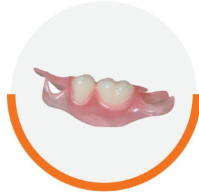
Protesi con 1-2-denti