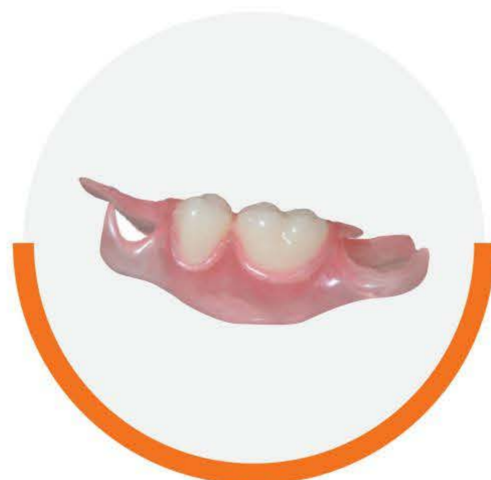
Protesi con 1-2-denti