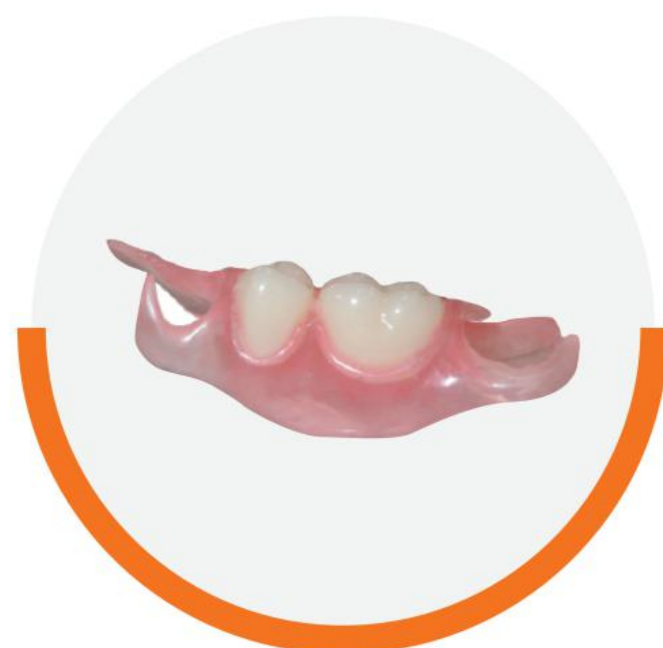
Protesi con 1-2-denti